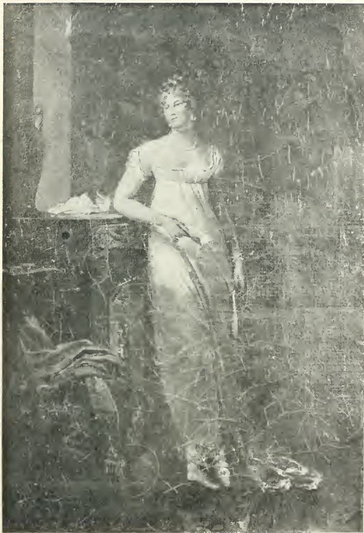
POURTRAIT DE MADAME DE TALLEYRAND